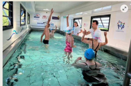
Le fond de la piscine est amovible pour s'adapter au niveau des enfants.

Ces enfants apprennent à nager dans... un camion : "En fait, c'est grand !"