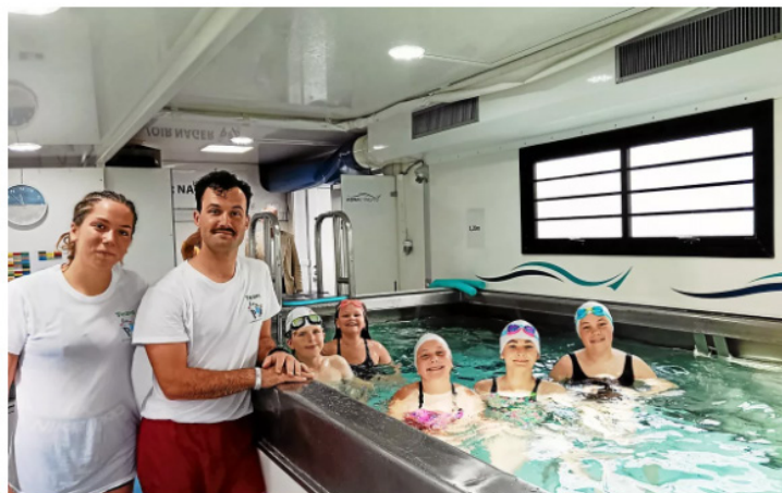
Les enfants de Ploërdut profitent, par petit groupe de cinq ou six, de « la salle de classe aquatique » d'Aqua-Itineris avec un maître-nageur et une surveillante de baignade.

Du 10 au 28 juin 2024, la commune de Ploërdut (56) accueille une école de natation itinérante pour les 60 élèves de l'école primaire. Le dispositif intervient en milieu rural pour lutter contre les noyades.